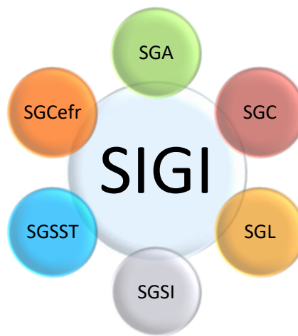
Figura 1: Componentes del SIGI